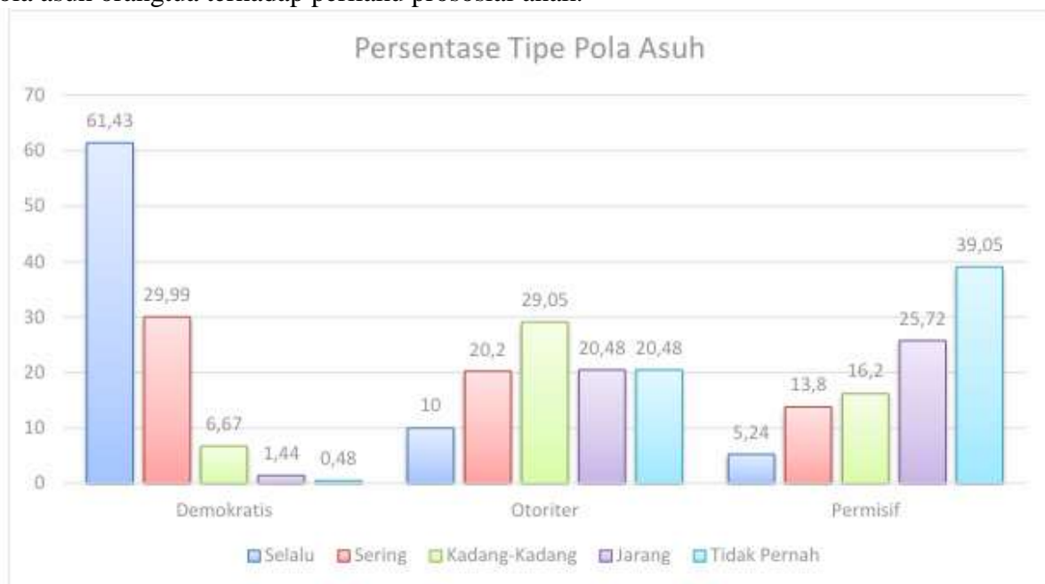
Gambar 1. Perbandingan Persentase Tipe Pola Asuh

Dari uraian hasil analisis tipe pola asuh orang tua diatas, maka penulis melakukan analisis implikasi tipe pola asuh tersebut dengan kepribadian anak. Analisis ini penulis dapat dengan memberikan pertanyaan singkat yang ada pada google form kepada orangtua anak. Indikator tentang Perilaku prososial anak diambil dari tipe perilaku prososial menurut salah satu ahli psikologi yaitu Gregory (Chairilisyah, 2012). Tabel 5 disajikan uraian penjelasan implikasi tipe pola asuh orangtua terhadap perilaku prososial anak.