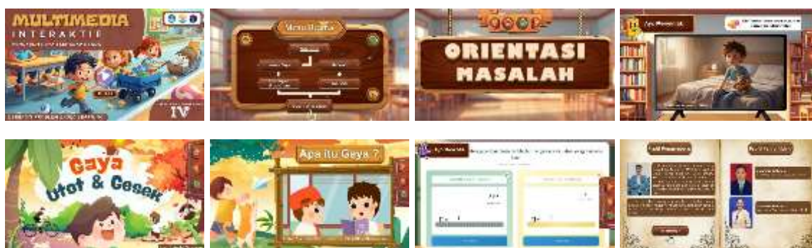
Gambar 2. Hasil Produk Multimedia Interaktif Berbasis Problem Based Learning

Tahap selanjutnya adalah tahap desain. Pada tahap ini, peneliti melakukan pengumpulan sumber referensi yang relevan, baik dari buku ajar IPAS maupun dokumen kurikulum yang berlaku. Selanjutnya, peneliti menyusun rancangan multimedia interaktif yang meliputi petunjuk penggunaan, penyajian materi, tampilan visual, serta evaluasi pembelajaran. Tahap pra-produksi dilakukan dengan menentukan perangkat lunak yang digunakan untuk mengembangkan multimedia interaktif, serta menyusun storyboard dan desain antarmuka. Pada tahap produksi, peneliti mengembangkan multimedia interaktif yang memuat materi pengaruh gaya terhadap benda, soal-soal latihan berbasis level, serta evaluasi akhir yang dirancang untuk melatih keterampilan berpikir kritis siswa. Berikut ini disajikan beberapa tampilan hasil pengembangan multimedia interaktif pada materi pengaruh gaya terhadap benda.