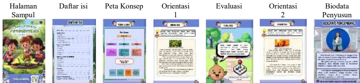
Gambar 1. Hasil Produk Media E-Modul Interaktif

tampilan visual, dan evaluasi pembelajaran. Rancangan yang telah disusun kemudian dikonsultasikan kepada dosen pembimbing untuk memperoleh masukan dan saran. Hasil konsultasi tersebut digunakan sebagai dasar evaluasi dan revisi rancangan sebelum dilanjutkan ke tahap pengembangan. Berikut ini disajikan beberapa tampilan hasil pengembangan e-modul interaktif pada materi fotosintesis.