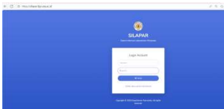
Gambar 1. Halaman Depan Aplikasi SILAPAR

Selain efisiensi waktu, implementasi SILAPAR juga meningkatkan kemudahan akses terhadap informasi inventaris. Pada sistem manual, informasi hanya dapat diperoleh melalui pengecekan fisik yang membutuhkan waktu dan tenaga. Sebaliknya, sistem digital memungkinkan pengguna untuk mengetahui ketersediaan alat dan bahan secara real-time. Hal ini tidak hanya meningkatkan efisiensi, tetapi juga mendukung pengambilan keputusan yang lebih cepat dan akurat dalam kegiatan praktikum.