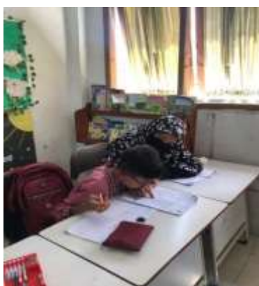
Gambar 2. GPK Mendampingi Anak Tuna Rungu

Hal ini juga didukung dengan observasi yang telah dilakukan oleh peneliti melihat bagaimana proses pembelajaran yang dilakukan oleh anak tuna rungu di dalam kelas. Peneliti melihat bagaimana peran wali kelas dan guru pendamping dalam proses pembelajaran. Hal tersebut dapat dilihat dengan bukti beberapa dokumen dibawah ini Gambar 2.