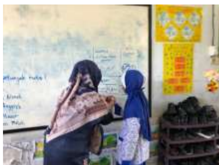
Gambar 3. Anak Tuna Rungu Dilibatkan Dalam Proses Pembelajaran