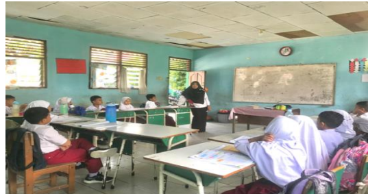
Gambar 2. Guru Dan Siswa Sudah Menggunakan Seragam Yang Telah Ditentukan

mengerjakannya sendiri. Peneliti menemukan ada siswa yang mencontek pada temannya, agar hal tersebut tidak terulang kembali maka guru memberikan jarak siswa ketika mengerjakan tugas.