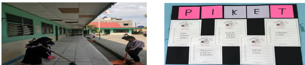
Gambar 5. Siswa Melaksanakan Piket Sesuai Jadwal