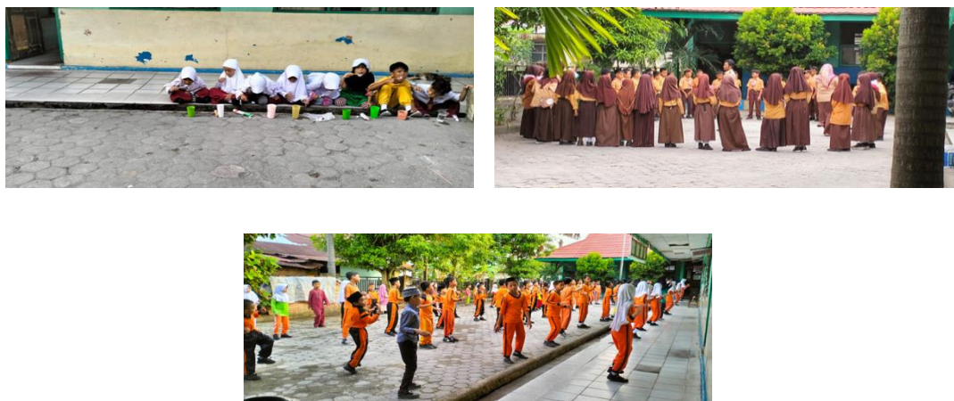
Gambar 6. Siswa Melaksanakan Pembiasaan

Maka Berdasarkan penyajian data di atas dapat disimpulkan bahwa pelaksanaan pendidikan karakter siswa kelas IV melalui pembiasaan melalui budaya sekolah telah berjalan sesuai dengan apa yang diharapkan dalam pendidikan karakter siswa, dalam pelaksanaannya tersebut guru membiasakan siswa dengan kegiatan setiap paginya, begiti juga dilakukan di dalam kelas siswa dibiasakan melaksanakan piket dengan baik, saling membantu, menghormati dan menghargai guru dan teman-temannya. Hal tersebut sudah dilaksanakan oleh siswa dan sudah mulai diterapkannya dengan baik di lingkungan sekolah.