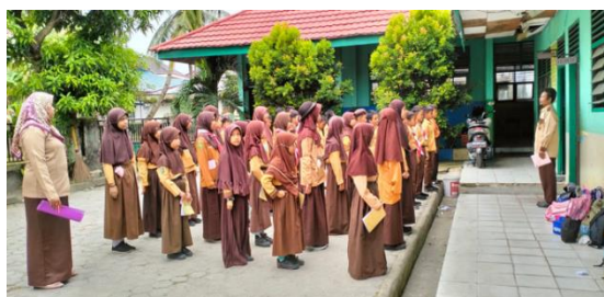
Gambar 4. Ekstrakurikuler Pramuka Yang Dilaksanakan Siswa

Maka berdasarkan penyajian data di atas dapat di simpulkan bahwa pelaksanaan pendidikan karakter siswa kelas IV melalui kegiatan ekstrakurikuler telah berjalan sesuai dengan apa yang di harapkan dalam pendidikan karakter siswa, dalam pelaksanaannya tersebut guru memasukan nilai karakter yang bisa terapkan nantinya, hal tersebut dilihat ketika siswa harus datang tepat waktu, memasukan nilai karakter ketika gerakan pramuka agar mereka berkerja sama dengan timnya dan bertanggung jawab, ekstrakurikuler pramuka selalu mengikuti panduan dari buku saku dan buku kecakapan pramuka siaga yang akan di praktek dan di ajarkan oleh siswa agar meeka memahaminya.