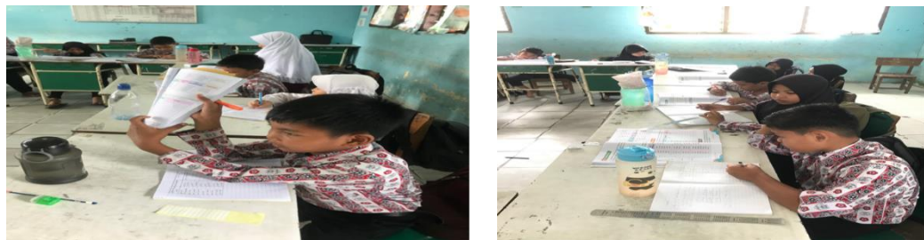
Gambar 3. Siswa Bertanya Saat Pembelajaran Dan Mengerjakan Tugas Dengan Baik Dan Mandiri