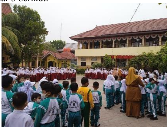
Gambar 5. Siswa Tidak Memakai Seragam

Berdasarkan hasil penelitian di lapangan, sejalan dengan teori di atas dapat disimpulkan bahwa dalam menciptakan lingkungan sekolah yang nyaman dan tertib untuk warga sekolah maka sekolah menerapkan tata tertib sekolah. Penerapan tata tertib di sekolah berguna untuk mencegah perilaku negatif yang tidak sesuai norma di lingkungan sekolah. Tata tertib sekolah tersebut merupakan hal penting dalam memajukan sekolah. Sekolah harus menjalankan tata tertib dengan konsisten baik dari guru maupun siswa sehingga mampu meningkatkan kualitas tingkah laku siswa. Dengan adanya tata tertib di sekolah membiasakan diri siswa bersikap baik dan taat pada aturan yang berlaku sehingga tidak banyak lagi terjadi pelanggaran-pelanggaran di sekolah seperti yg dapat dilihat dari Gambar 5 berikut.