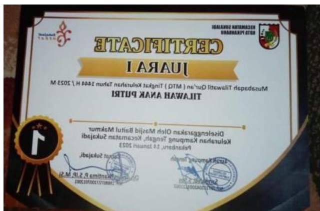
Gambar 3. Sertifikat Lomba Tilawah