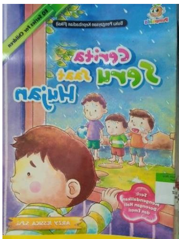
Gambar 2. Buku Dongeng

Buku fiksi cerita semut dan hujan merupakan salah satu buku yang digunakan siswa dalam kegiatan membaca di kelas untuk melaksanakan program literasi sekolah.