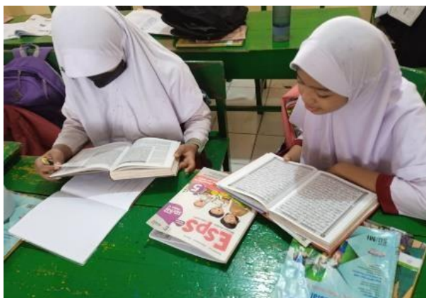
Gambar 4. Kegiatan Awal dan Akhir Pembelajaran

Kegiatan awal dan akhir pembelajaran merupakan proses seseorang dalam melakukan suatu kegiatan yang tadinya tidak biasa menjadi terbiasa. Terutama pada lembaga pendidikan merupakan kesempatan pertama yang sangat baik untuk membina atau memperbaiki pribadi anak yang kurang baik. Pembiasaan-pembiasaan di sekolah akan memberikan kesempatan bagi siswa untuk mengamalkan perilaku-perilaku yang baik dalam kehidupan sehari-hari dapat dilihat pada Gambar 4. Krisnawati (2022:8) mengungkapkan bahwa menetapkan kegiatan pembiasaan awal dan akhir KMB adalah salah satu elemen yang sangat penting sekali dalam dunia pendidikan terutama pada anak-anak. Anak usia dini belum biasa membedakan perkataan yang benar dan perkataan yang buruk atau bisa disebut dengan susila. Anak-anak juga mempunyai kewajiban yang harus dikerjakan seperti orang dewasa, akan tetapi mereka mempunyai hak untuk rawat, mendapatkan pendidikan, mendapatkan perlindungan, dan bimbingan. Menanamkan kebiasaan pada anak usia dini sangat sukar karena membutuhkan waktu yang sangat lama dalam proses menjadikan fungsional dalam diri anak.