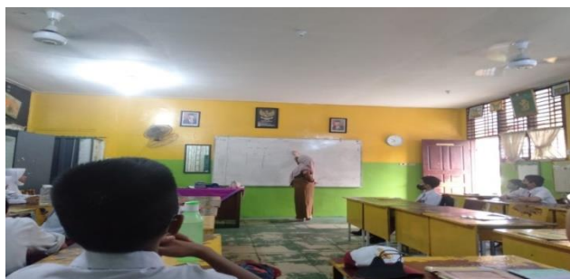
Gambar 1. Guru menuliskan dan menjelaskan materi pembelajaran

Hal ini sejalan dengan hasil wawancara bersama ibu AR yang mengatakan bahwa dalam menyampaikan pesan atau materi pembelajaran guru terkadang menuliskan materi dan terkadang juga tidak menuliskan materi pembelajaran, Hal serupa juga disampaikan oleh ibu AGW yang mengatakan saat proses pembelajaran terkadang menuliskan materi pembelajaran terk adan juga tidak, namun ibu AGW menambahkan jika tidak menuliskan materi dipapan tulis ia mendiktekan siswa.