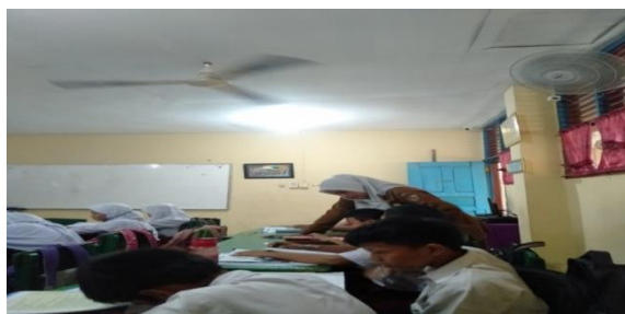
Gambar 3. Guru mengelus pundak siswa

dalam mengerjakan tugas, gambar tersebut yakni :