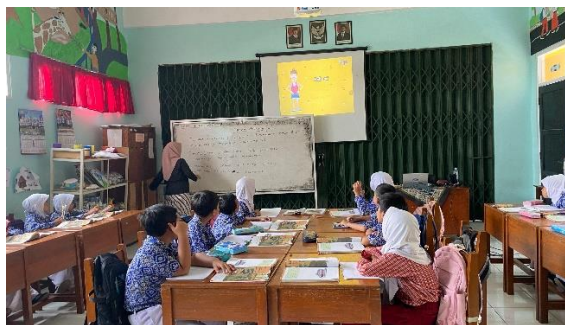
Gambar 1 Media Interaktif

Berdasarkan gambar 1, dapat dijelaskan bahwa penggunaan media visual dan audio dalam hal ini penggunaan proyektor saat pembelajaran dapat membantu anak-anak termasuk anak berkebutuhan khusus untuk lebih fokus dalam menyimak pembelajaran dan menyerap berbagai informasi yang diberikan oleh guru dengan mudah.