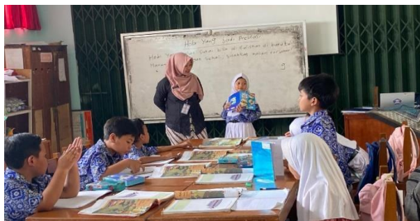
Gambar 2 Peserta didik maju kedepan kelas

Berdasarkan gambar 2, dapat dijelaskan bahwa cara guru untuk mempersilahkan peserta didik maju kedepan kelas dapat membantu peserta didik untuk lebih percaya diri dalam menyampaikan pendapat. Dari cara sederhana itu guru akan terbantu dalam mengeksplorasi minat dan bakat anak.