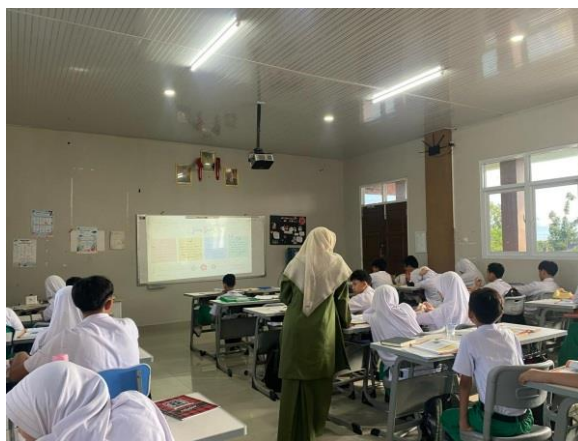
Gambar 1.1 Suasana Belajar Kelas VII A

Dalam kelas VII A, suasana belajar terpantau kondusif. Guru menciptakan interaksi belajar yang aktif dan menyenangkan. Para siswa menunjukkan ketertarikan yang tinggi terhadap model pembelajaran digital berbasis LMS, khususnya karena mereka dapat mengakses materi kapan pun dan di mana pun. LMS yang digunakan sekolah menyediakan berbagai fitur, seperti unggahan materi, kuis interaktif, forum diskusi, dan sistem penilaian otomatis.