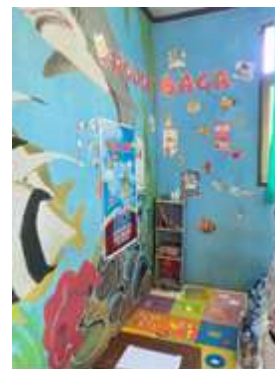
Gambar 1: Kegiatan gemar membaca Gambar 2: Jurnal belajar malam Gambar 3: Pojok baca

Program-program yang dilaksanakan di sekolah Kedungpane 02, seperti Gemar Membaca, Kegiatan Literasi Menulis, Jurnal Belajar Malam, dan pengembangan Pojok Baca, yang bertujuan untuk meningkatkan pemahaman membaca siswa. Kegiatan Gemar Membaca dilaksanakan setiap Rabu, di mana siswa membaca di depan kelas sebelum dan sesudah pembelajaran, dengan harapan dapat membiasakan mereka untuk membaca secara rutin. Kegiatan Literasi Menulis yang dijadwalkan pada akhir pekan memberikan kesempatan bagi siswa untuk menulis sinopsis dari bacaan mereka, sehingga meningkatkan pemahaman sekaligus kemampuan mereka untuk menceritakan kembali isi bacaan. Jurnal Belajar Malam juga berperan penting dalam memantau kebiasaan membaca siswa di rumah, di mana orang tua mengisi jurnal ini untuk mencatat kegiatan membaca anak dan guru memeriksanya setiap minggu.