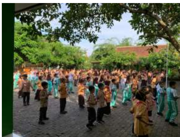
Gambar 3 Siswa melakukan kegiatan senam rutin di sekolah

Wawancara dengan guru kelas menunjukkan bahwasanya program senam sudah sejak lama menjadi program sekolah, namun semenjak adanya program “7 Kebiasaan Anak Indonesia Hebat” kegiatan ini semakin diperkuat menjadi bagian penting dari pembiasaan hidup sehat di sekolah. Sekolah menerapkan program senam rutin juga bertujuan untuk meningkatkan kebugaran siswa-siswanya, karena dengan kebugaran yang baik siswa sekolah dapat belajar secara maksimal, sehingga sanggup menggapai tujuan pembelajaran secara optimal (Kusnandar et al., 2019) Menurut guru olahraga SDN 01 Bringin, kegiatan senam rutin ini merupakan kebijakan dari pemerintah pusat yang dilaksanakan secara bertahap di sekolah. Melalui pengamatan langsung oleh peneliti, terlihat senam diadakan pada jam 07.30 sebelum pembelajaran dimulai, senam dipimpin oleh guru olahraga dan diikuti seluruh warga sekolah. Siswa dari kelas satu sampai kelas enam berjejer baris sesuai dengan kelasnya masing-masing.