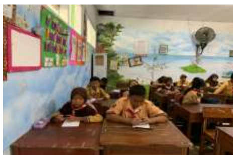
Gambar 4 Siswa melakukan pengisian kuisioner

Hasil penelitian menunjukkan bahwa mayoritas siswa memberikan respon positif terhadap implementasi program senam rutin di SD Negeri Bringin 01. Para siswa merasa lebih senang, nyaman, serta mengalami peningkatan konsentrasi dan semangat belajar setelah mengikuti senam. Temuan ini sejalan dengan pendapat (Aprilia & Januarto, 2022) yang menyatakan bahwa siswa yang aktif secara fisik memiliki tingkat konsentrasi belajar yang lebih tinggi dibandingkan siswa yang kurang aktif. Selain itu, aktivitas fisik terbukti secara ilmiah dapat meningkatkan fungsi kognitif dan suasana hati siswa, peningkatan aliran darah ke otak akibat aktivitas fisik berdampak pada peningkatan kemampuan kognitif (Ayuni et al., 2024) Program senam juga menciptakan suasana sosial yang lebih positif, di mana siswa merasakan adanya kedekatan emosional yang lebih kuat dengan guru dan teman-teman mereka. Hal ini penting untuk membentuk interaksi sosial yang sehat, memperkuat iklim belajar yang kolaboratif, serta mendukung pembentukan karakter sejak usia dini. Musik yang digunakan saat senam turut menjadi faktor pendorong yang signifikan (Khofifah et al., 2023), karena mampu membangun semangat dan antusiasme siswa untuk berpartisipasi aktif. Musik dalam aktivitas fisik terbukti secara psikologis dapat meningkatkan mood dan menurunkan tingkat kejenuhan, sehingga aktivitas menjadi lebih menyenangkan dan dinantikan siswa.