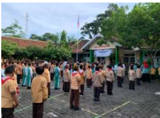
Gambar 2 Siswa melakukan kegiatan senam rutin di sekolah

di sekolah dasar maupun di instansi lain karena senam kesegaran jasmani ini sederhana dan mudah untuk dilakukan oleh siswa maupun orang yang masih awam, senam ini juga sangat mengasyikan saat dilakukan karena lagu yang membuat semangat dan gerakan yang tidak rumit (Amalia et al., 2022). Dalam Buku Panduan SKJ Indonesia Bersatu 2018 (Kemenpora, 2018) dilakukan dengan tiga urutan yaitu: 1) Pemanasan, yang terdiri atas Pemanasan Sikap Awal, Gerakan I, Gerakan II, Gerakan III, Gerakan IV, Gerakan V, Gerakan VI, Gerakan VII, Gerakan VIII, Gerakan IX, dan Gerakan X. 2) Inti, Gerakan Awal Peralihan, Inti I, Inti II, Inti III, Inti IV, dan Inti V. 3) Pendinginan, terdiri atas gerakan Pendinginan dan Pengaturan nafas. sedangkan untuk hari rabu kegiatan senam dilaksanakan dengan durasi yang lebih pendek, kegiatan senam rutin ini melibatkan seluruh elemen warga sekolah, mulai dari guru kelas, guru olahraga, hingga kepala sekolah, dengan guru olahraga sebagai pemandu utama senam.