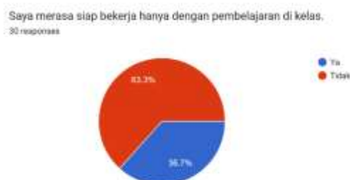
Gambar 1. Data Hasil Observasi Awal (Tingkat Kesiapan Kerja Mahasiswa)

Mengacu pada data Badan Pusat Statistik (BPS) yang ditampilkan dalam Gambar 1, tingkat pengangguran lulusan Diploma dan Sarjana selama periode 2013–2024 menunjukkan pola yang fluktuatif dari tahun ke tahun. Kondisi ini mencerminkan adanya ketidaksesuaian antara kompetensi lulusan—yang mencakup pengetahuan, keterampilan, dan kemampuan—dengan kebutuhan industri saat ini. Oleh karena itu, perguruan tinggi dituntut untuk lebih optimal dalam menyiapkan mahasiswanya agar siap bersaing di dunia kerja. Di sisi lain, mahasiswa juga memiliki tanggung jawab untuk mempersiapkan diri agar memiliki kesiapan kerja sesuai tuntutan dunia industri. Kesiapan kerja tersebut ditopang oleh kematangan mental dan fisik, pengalaman belajar yang memadai, kemampuan komunikasi yang baik, sikap tanggung jawab, serta komitmen untuk terus mengikuti perkembangan dalam bidang keahliannya (Putri Pambajeng, Sumartik, & Maya Kumala Sari, 2024).