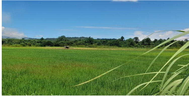
Gambar 2. Tampak persawahan Kampung Karya Bumi Besum

Analisis batubara yang diambil dari daerah Mawesday menunjukkan bahwa sampel yang digunakan adalah batubara jenis lignit dan bituminous dengan peringkat rendah berdasarkan hasil uji laboratorium. Nilai kalor yang diperoleh sebesar 4,85 cal/g mengindikasikan bahwa batubara ini tidak optimal digunakan sebagai bahan bakar energi langsung, tetapi potensial untuk dimanfaatkan sebagai sumber senyawa humat. Kandungan total senyawa humat yang tinggi pada sampel ini berbanding lurus dengan kadar kelembaban ( moisture in air dried sample ) sebesar 20,49%, yang mengindikasikan struktur batubara memiliki porositas dan gugus fungsi oksigen yang cukup untuk proses pembentukan dan pelepasan asam humat. Kandungan abu ( ash content ) yang terukur sebesar 4,33% juga berperan positif dalam mendukung pertumbuhan tanaman, khususnya pembentukan klorofil pada daun, sebagaimana diungkapkan oleh Wahidah et al. (2022) bahwa unsur mineral tertentu dalam abu batubara dapat memberikan nutrisi tambahan pada tanah. Kampung Karya Bumi Besum, dengan litologi yang didominasi oleh endapan fluvial, merupakan daerah persawahan yang sangat bergantung pada produktivitas tanah aluvial.