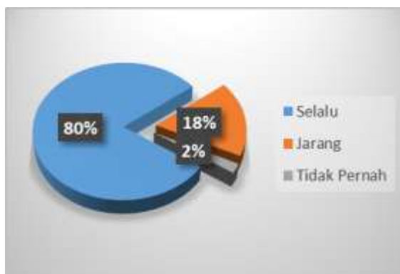
Gambar 5 Diagram Membimbing Peserta Didik Melaksanakan Ibadah

Gambar 5 Guru selalu membimbing siswa untuk melakukan ibadah sunah yang baik seperti Dhuha dan membaca Al-Qur'an atau sholat dzuhur, ini mengatakan 80% siswa merasa dipimpin oleh guru dalam beribadah. Siswa dalam beribadah menerima sikap religius yang mendorong mereka untuk beribadah dalam kehidupan, 18% jarang membimbing peserta didik melaksanakan ibadah dan 2% tidak pernah.