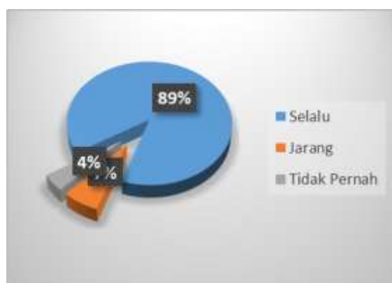
Gambar 6 Diagram Meminta Mengumpulkan Tugas Tepat Waktu

Gambar 6 Guru dalam meningkatkan kualitas kedisiplinan siswa meminta agar semua siswa dapat meninggalkan tugas tepat pada waktunya, guru melakukan hal tersebut untuk setiap tugas yang diberikan dibuktikan dengan 89% siswa yang menjawab bahwa guru sering diminta agar tugas-tugas dikerjakan tepat waktu, meskipun 7% yang jarang, 4% tidak pernah mengatakan bahwa hal ini dikarenakan keadaan siswa yang dianggap tidak memungkinkan untuk meminta mereka menyelesaikan tugas dengan waktu yang diberikan kepada beberapa kearifan umat ini sebagai bagian dari toleransi dan kecocokan keterampilan karena tidak semua siswa memiliki keterampilan yang sama.