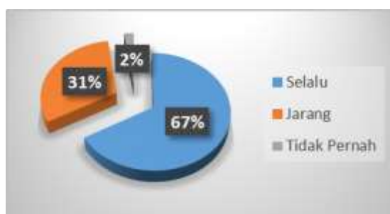
Gambar 3 Diagram Memberikan Perhatian Kepada Setiap Murid

3. Memberikan perhatian kepada setiap murid