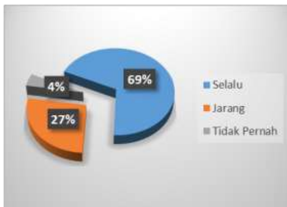
Gambar 7 Diagram Memberikan Dorongan Motivasi Belajar

Gambar 7, Pembelajaran adalah kegiatan yang tidak hanya karena keinginan internal, tetapi juga melalui dorongan orang lain, termasuk dorongan guru, untuk meningkatkan kualitas pembelajaran, dan siswa untuk bertanggung jawab atas pembelajarannya, guru selalu memberikan motivasi yang memotivasi untuk belajar dan mereka merasa bahwa dengan mengatakan 69% guru selalu memotivasi mereka untuk belajar, 27% guru jarang memotivasi mereka untuk belajar dan 4% guru tidak pernah memotivasi mereka untuk belajar.