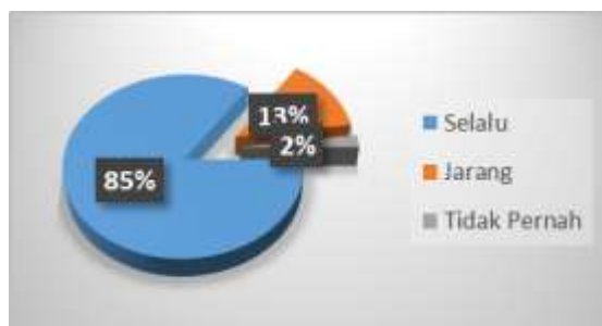
Gambar 2 Diagram Menunjukkan Tata Tertib Dalam Kelas