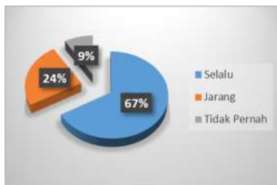
Gambar 4 Diagram Tugas Saat Mangajar

Gambar 4 Pernyataan siswa tentang kerasnya guru dalam mengajar sangat bervariasi, 67% diketahui bahwa guru selalu tegas dalam mengajar, memberikan teguran atau hukuman lainnya